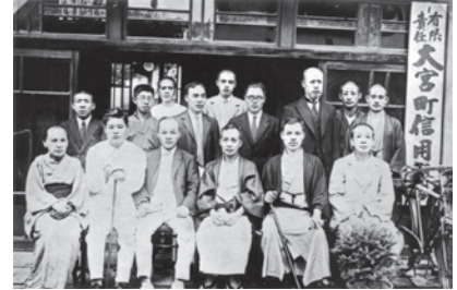
有限責任大宮町信用組合